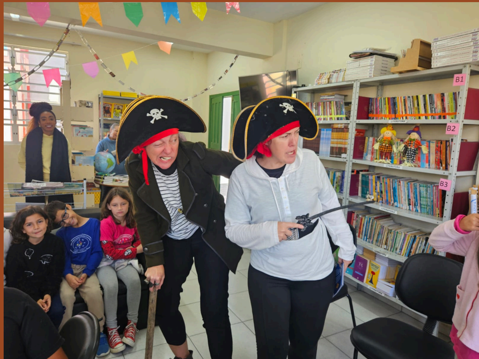
Escola Básica Padre Vicente Ferreira Cordeiro