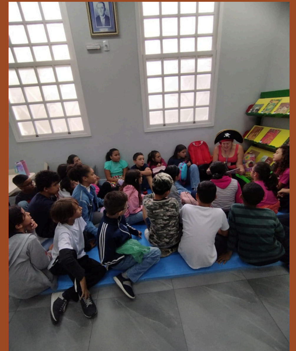
Biblioteca Pública Municipal de Palhoça Guilherme Wiethorn Filho