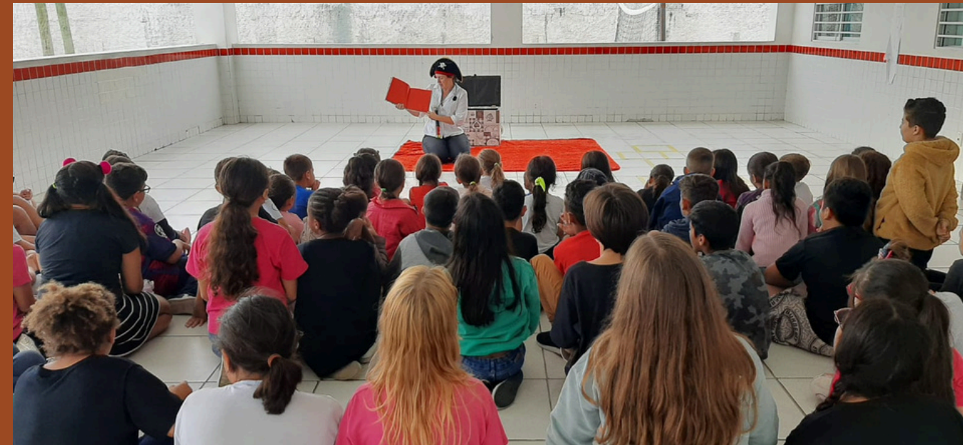
Escola Básica Francisca Raimunda Farias da Costa