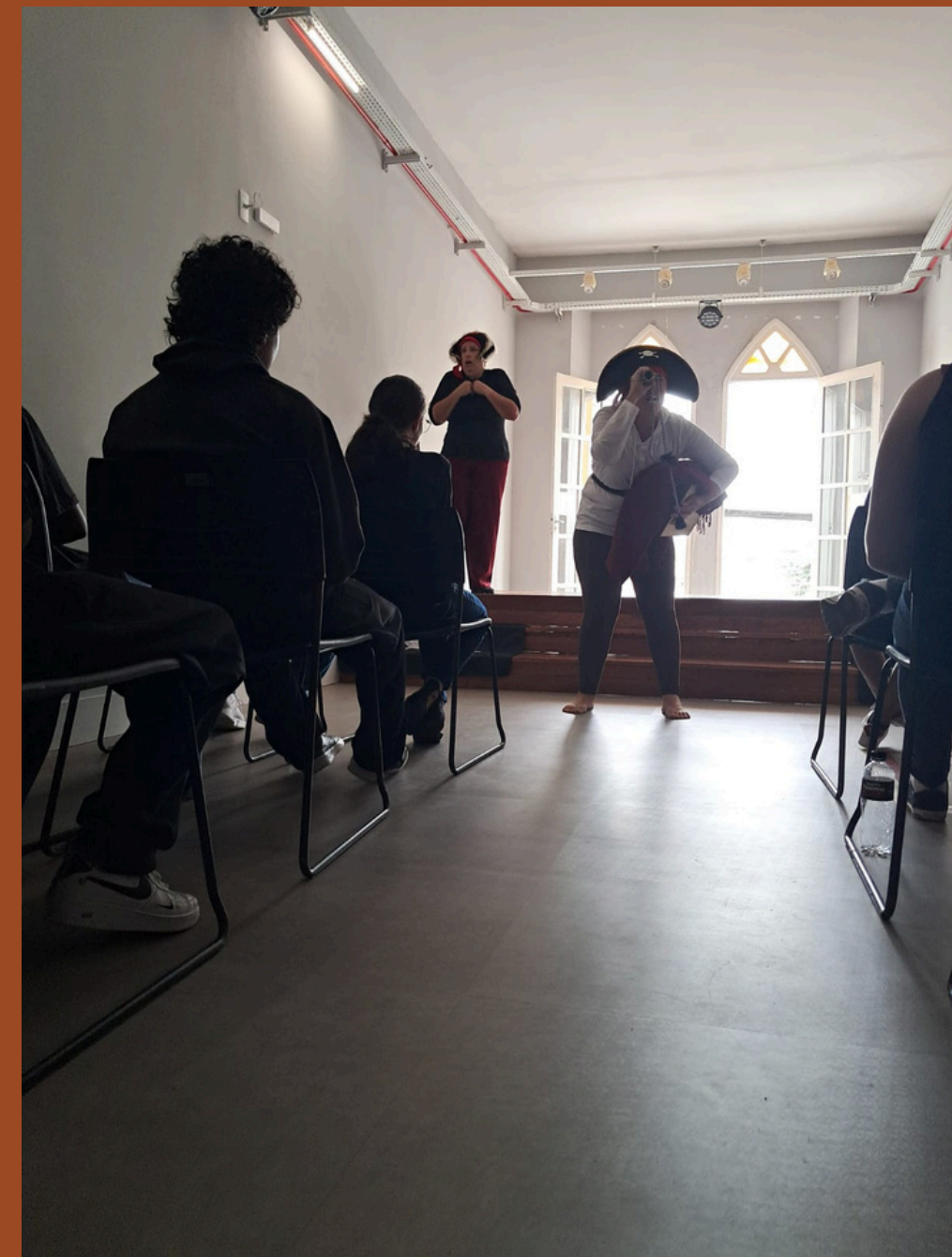
Centro Cultural Laudelino Weiss