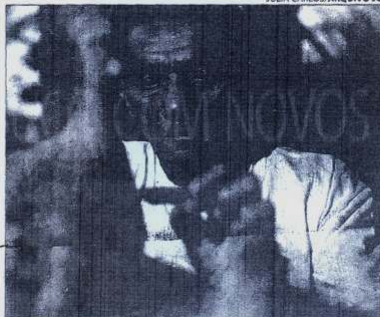
INTERIOR O artesanato de Tracunhaém está num dos novos roteiros

Os roteiros pernambucanos envolvem o Litoral e a Mata Norte, o Sertão do São Francisco, o Agreste e – já mais conhecidos do mercado nacional – o Litoral Sul e a Região Metropolitana do Recife. Da porção Norte do Estado, por exemplo, será feita a promoção institucional do turismo náutico e do turismo rural em municípios como Paulista,