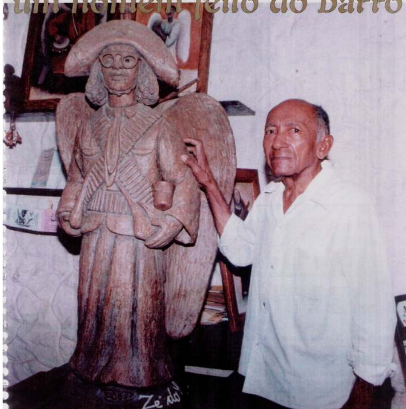
Em seu ateliê, o mestre do barro, ao lado de sua obra mais famosa, o Anjo-Cangaceiro