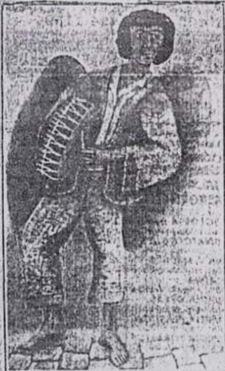
O ceramista transportou para seus quadros o que fazia em barro: anjos

pulares e feitas com uma mistura de tinta artesanal (extraída do barro) e tinta industrializada.