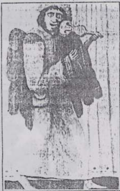
Outro trabalho do artista pernambucano