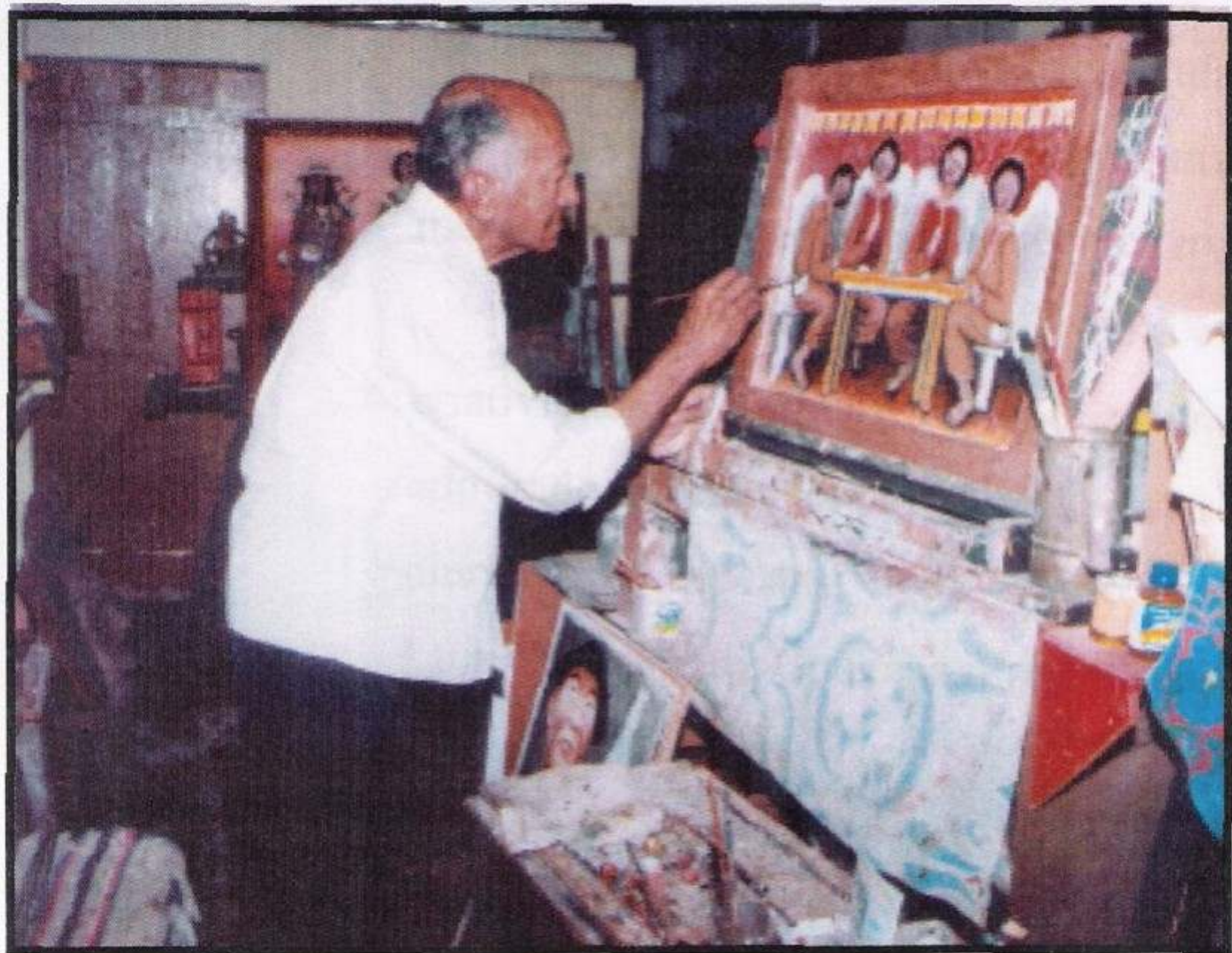
Agosto de 2005: o artista em plena forma