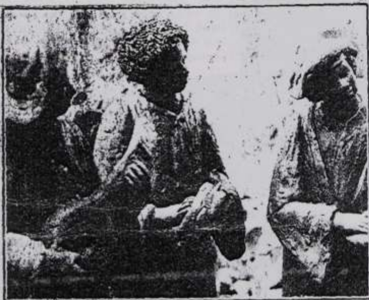
Trio sonoro de anjos