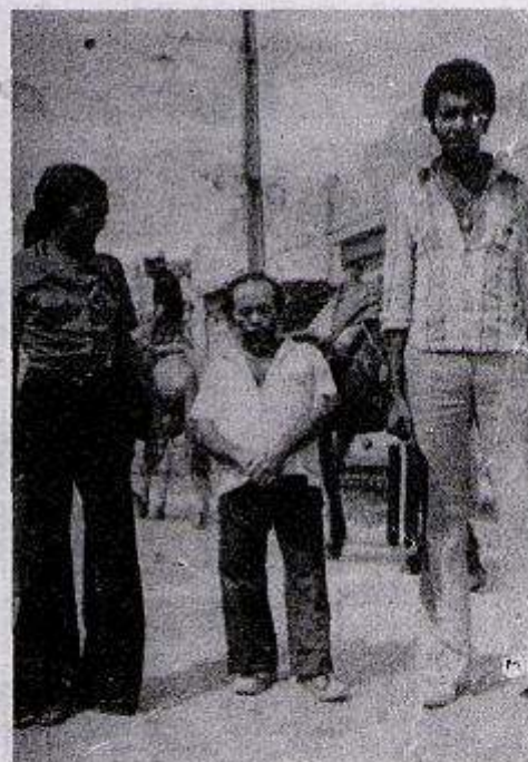
O circo "Gran Londres" tem dez artistas

— Depois, começou o fracasso: tive uma lesão pulmonar e fiquei internada no Hospital Otávio de Freitas. Esta lesão pulmonar foi por causa de um desgosto; meu marido começou a gostar de uma menina de circo, e depois me abandonou. Eu sofri muito, o senhor não imagina quanto eu já sofri. Esse homem que eu hoje vivo com ele, eu conheci no hospital. Ele não sabia nada de circo. Hoje, faz a apresentação do espetáculo.