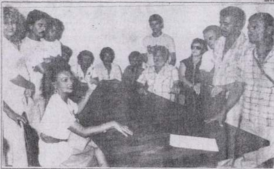
Como líder de classe, lutando sempre pelo interesse dos circenses