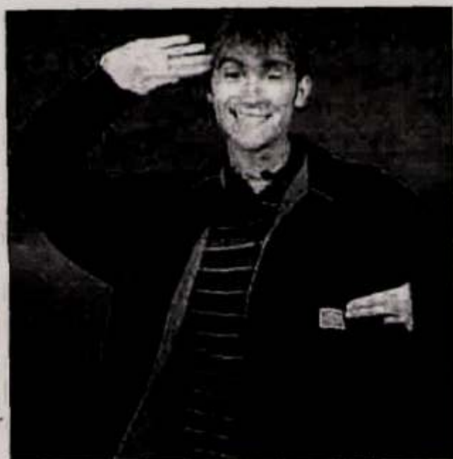
GURU Damon Albarn será reverenciado na festa