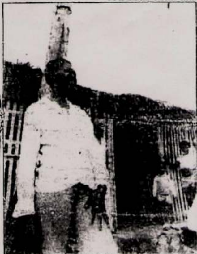
Lia de Itamaracá: cantar sob os coqueiros