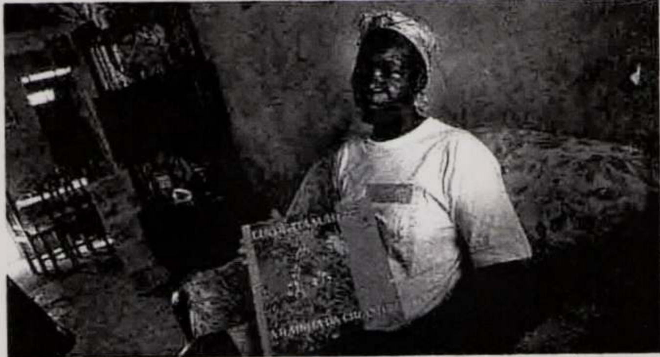
A cirandeira Lia de Itamaracá, que encerrou a última noite da sexta edição do festival pernambucano

ABRIL PRO ROCK terça-feira, 7 de abril de 1998 ilustrada