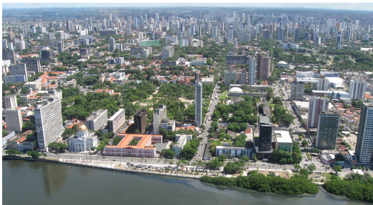
Figura 3 - Rua da Aurora trecho entre as Pontes Princesa Isabel e Limoeiro