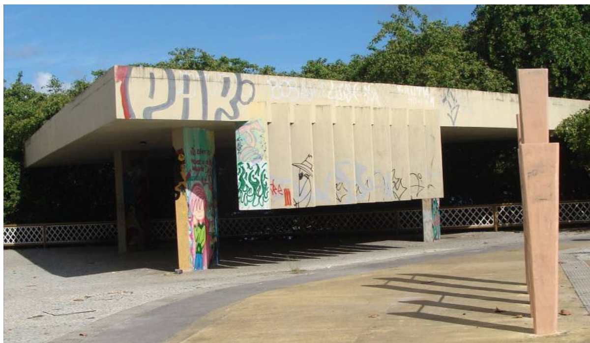
Figura 11 - Espaço da Rua da Aurora – Pichações e grafitagens