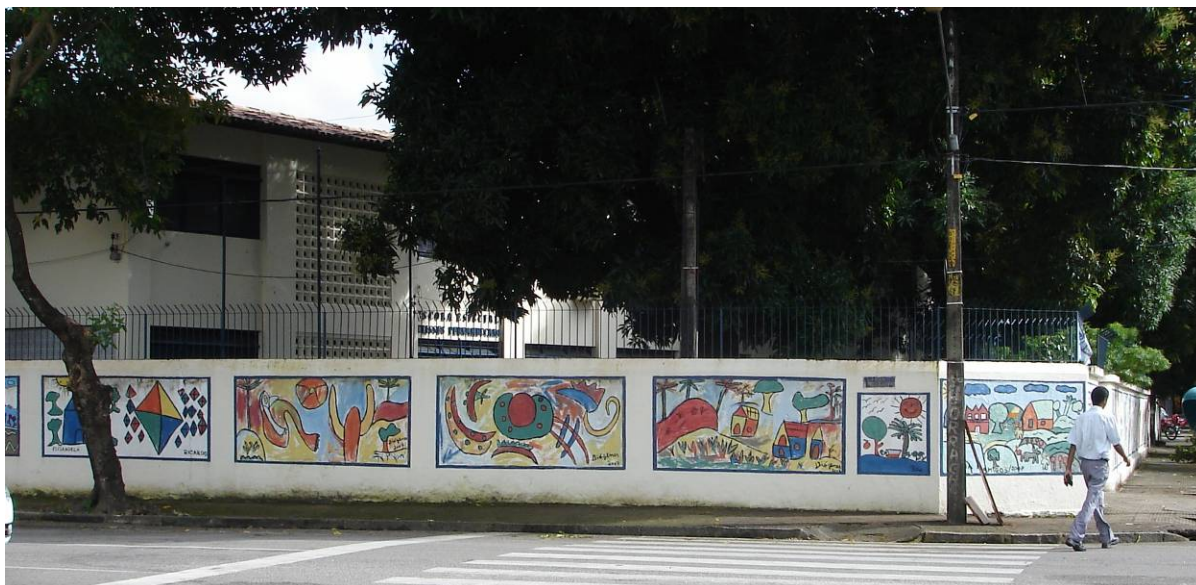
Figura 4 - Grafiteagem no Muro da Escola Especial Ulisses Pernambucano - Rua Gouveia de Barros, 198