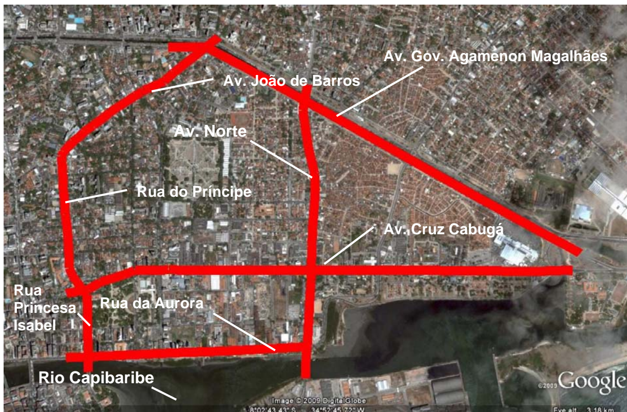
Figura 2 - Limites e principais eixos de Santo Amaro