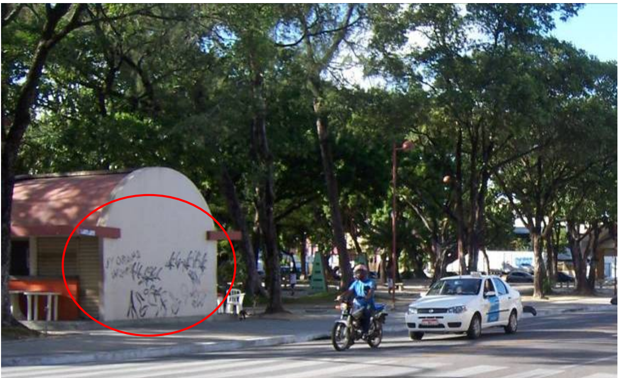
Figura 7 - Rua Treze de Maio/ Praça do Campo Santo – Pichações