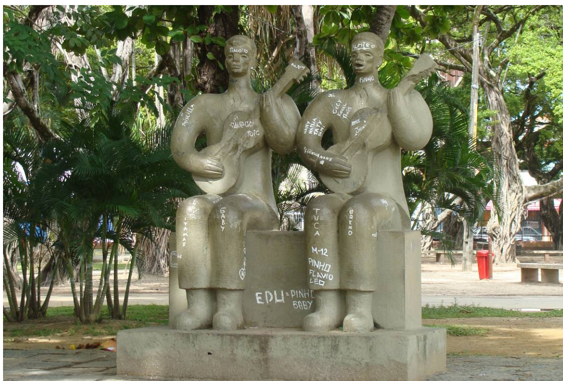
Figura 10 - Parque 13 de Maio- Esculturas de Violeiros de Abelardo da Hora – Pichações