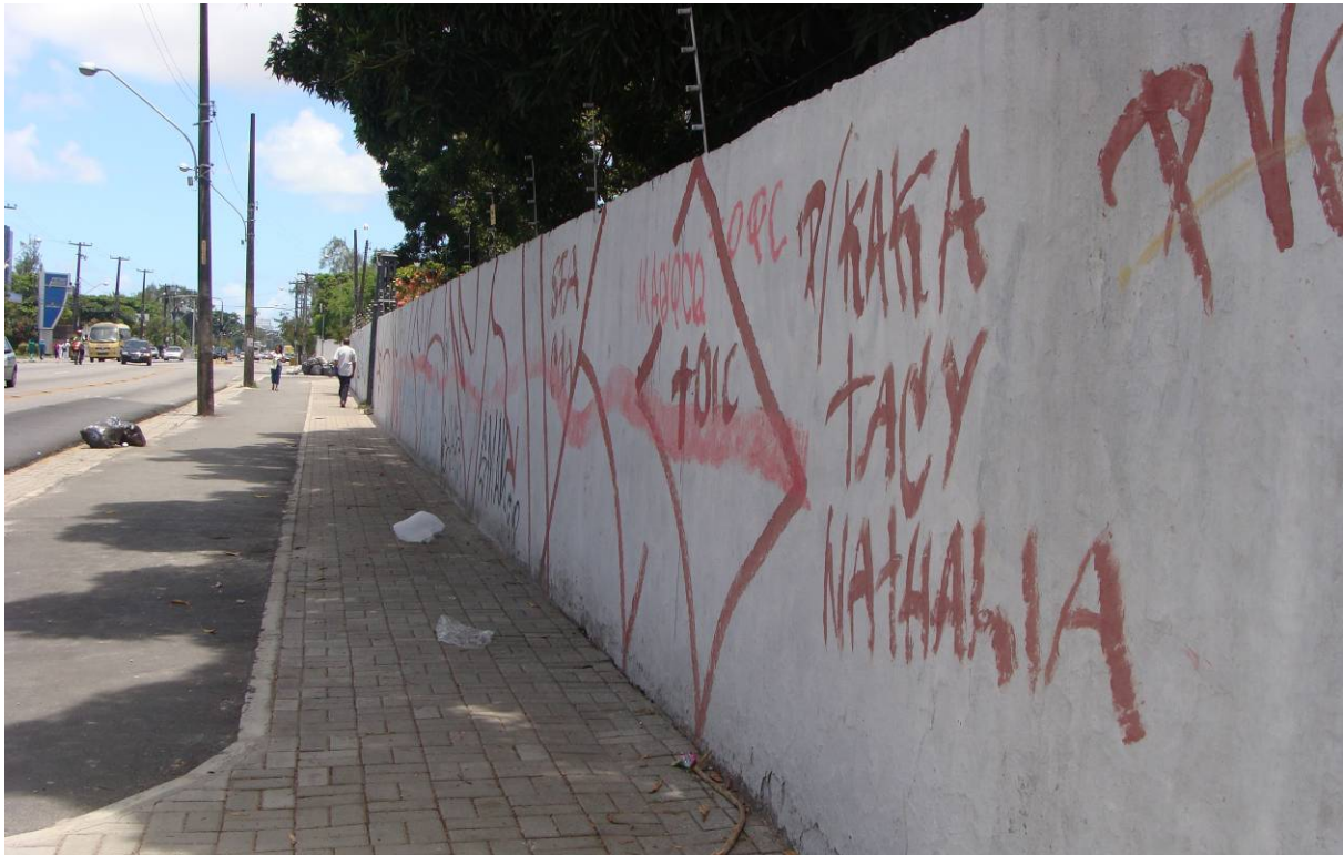
Figura 8 - Muro do Cemitério dos Ingleses – Bem tombado – Pichações