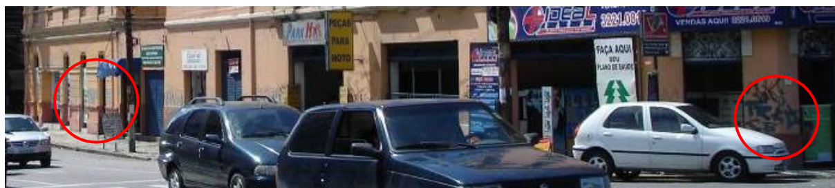
Figura 5 - Esquina das Ruas Princesa Isabel com Aurora na Ponte Princesa Isabel

Para visualização das ações das pichações e grafiteagens em alguns patrimônios de Santo Amaro, apresentamos as Figuras 5 a 11 como amostras no bairro.