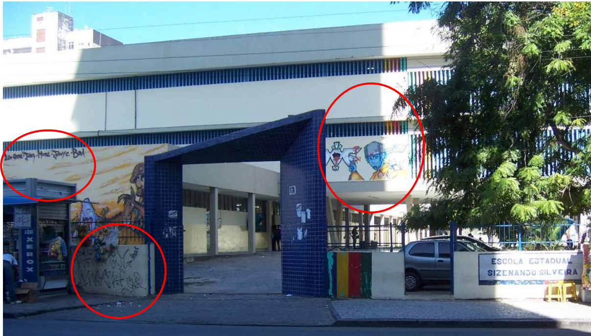
Figura 6 - Rua do Hospício Escola Sizenando Silveira – Pichações e grafitagens Fonte: CARDOSO, Frederico e SABINO FILHO, David, maio,2009.