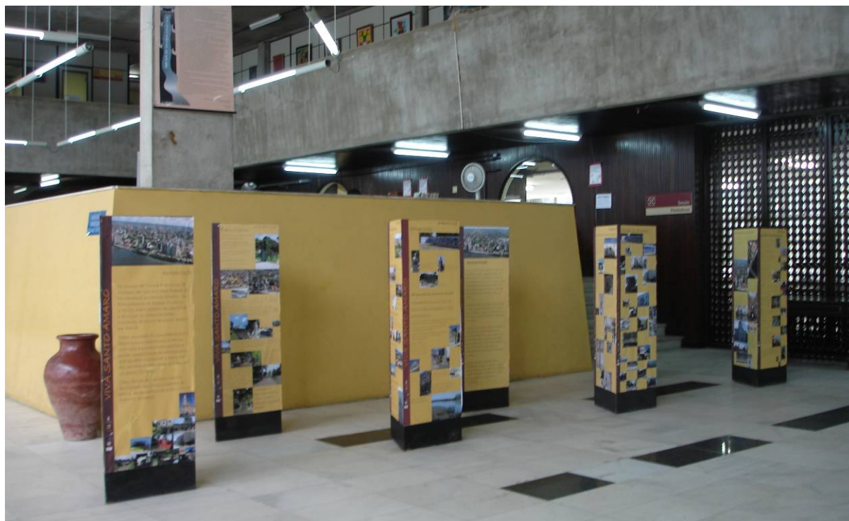
Figura 12 - Exposição itinerante – Hall da Biblioteca Pública do Estado - período 6 a 31 de julho de 2009

internet tem também funcionado como um instrumento nas atividades de Educação Patrimonial.