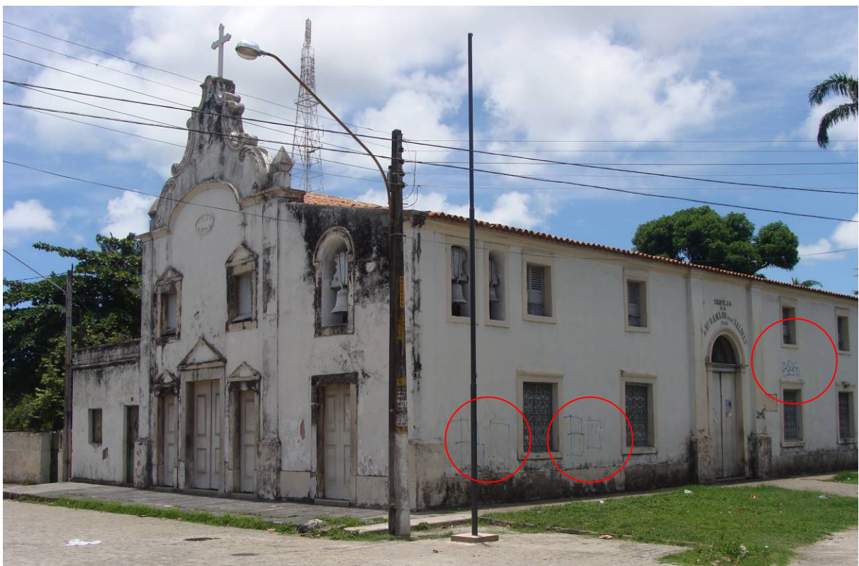
Figura 9 - Fachada lateral da Igreja de Santo Amaro das Salinas, bem tombado-Pichações