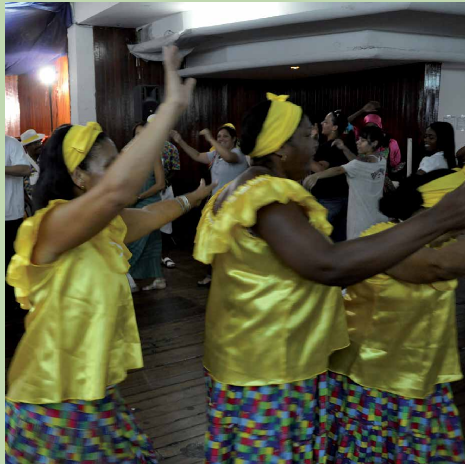
Apresentação de Samba de Roda. Local: Clube Floresta.