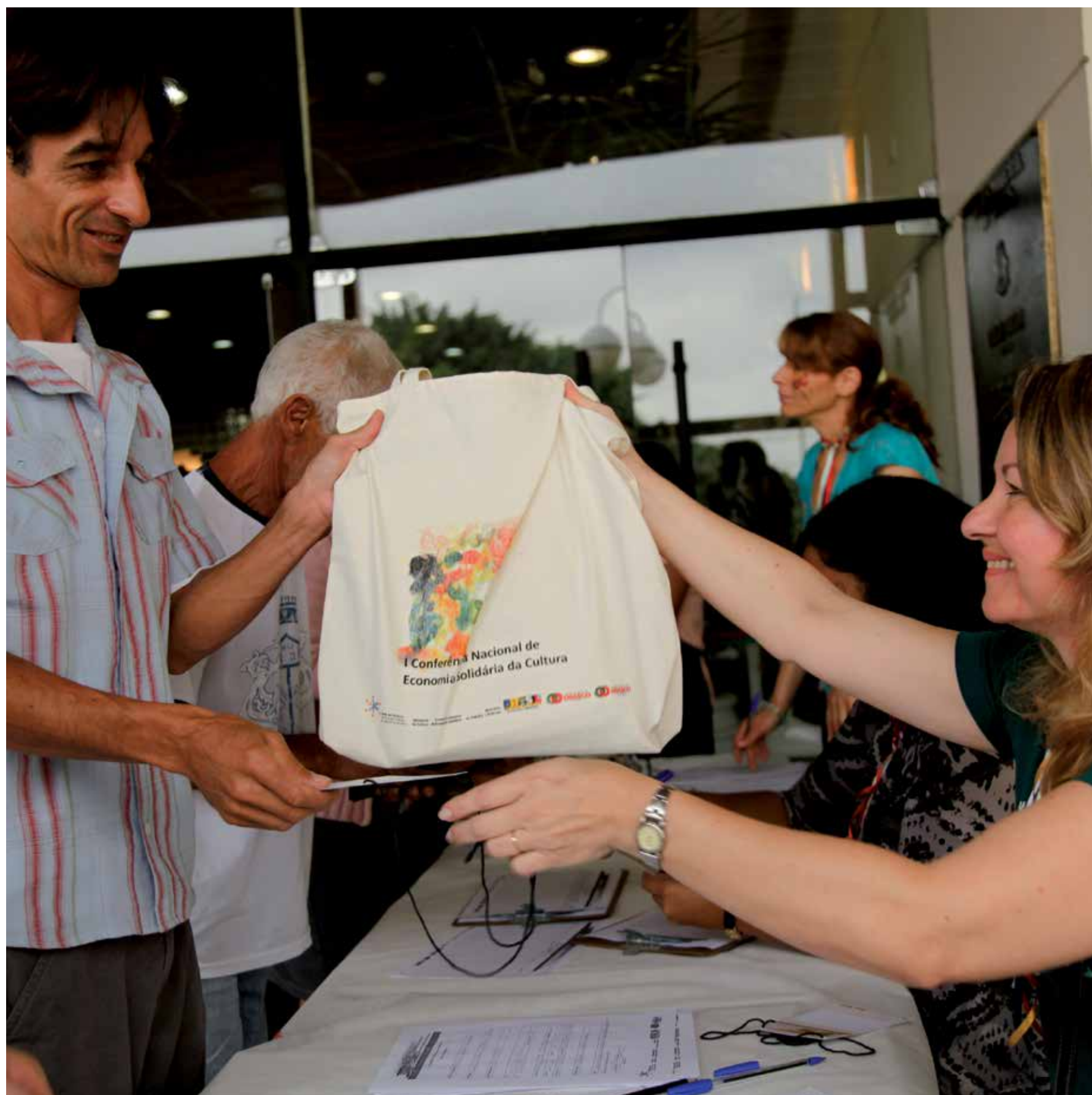
Chegada dos participantes. Local: Teatro Municipal.