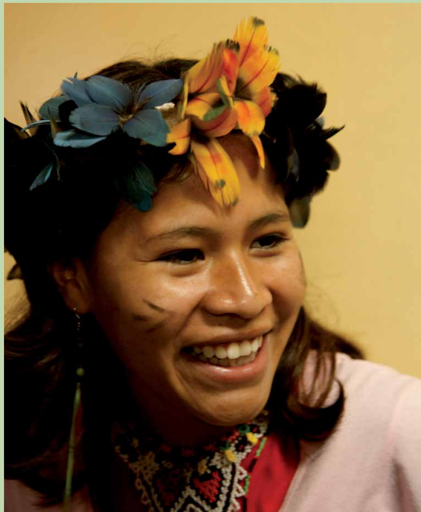
Integrante do Coral Guarani.