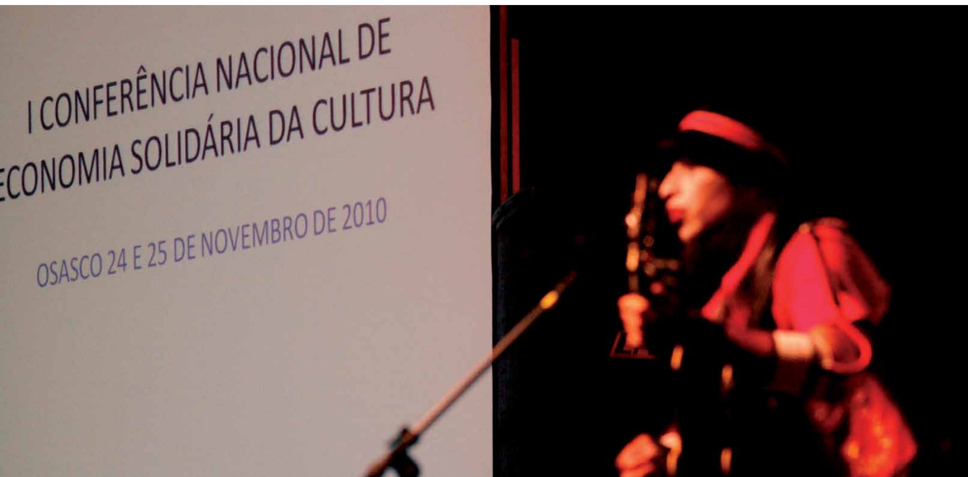
O Teatro Mágico. Local: Teatro Municipal.

16h Plenária final - Apresentação e votação do texto final da Carta de Osasco