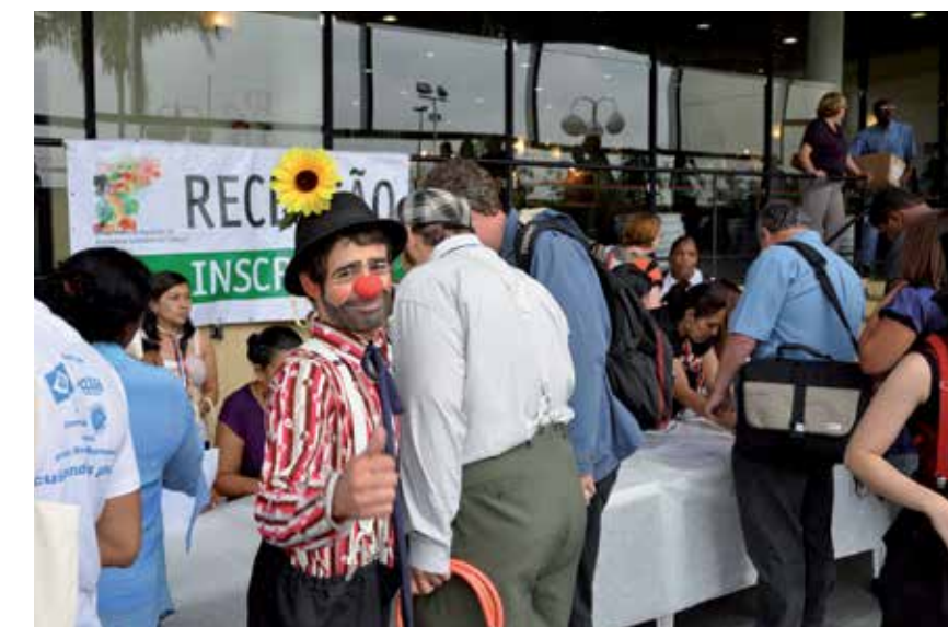
Doutores da Alegria recebendo participantes.