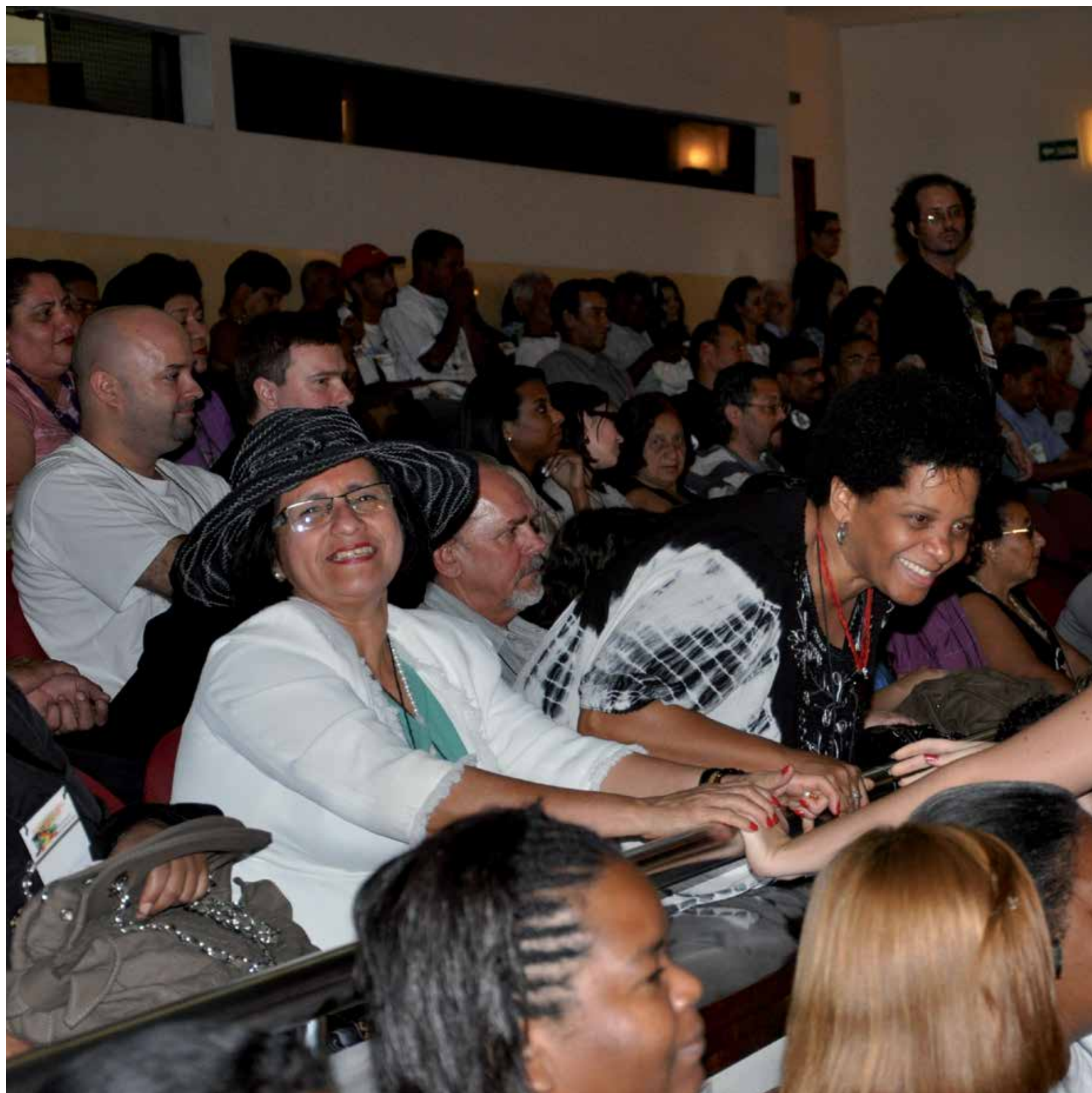
Teatro Municipal.