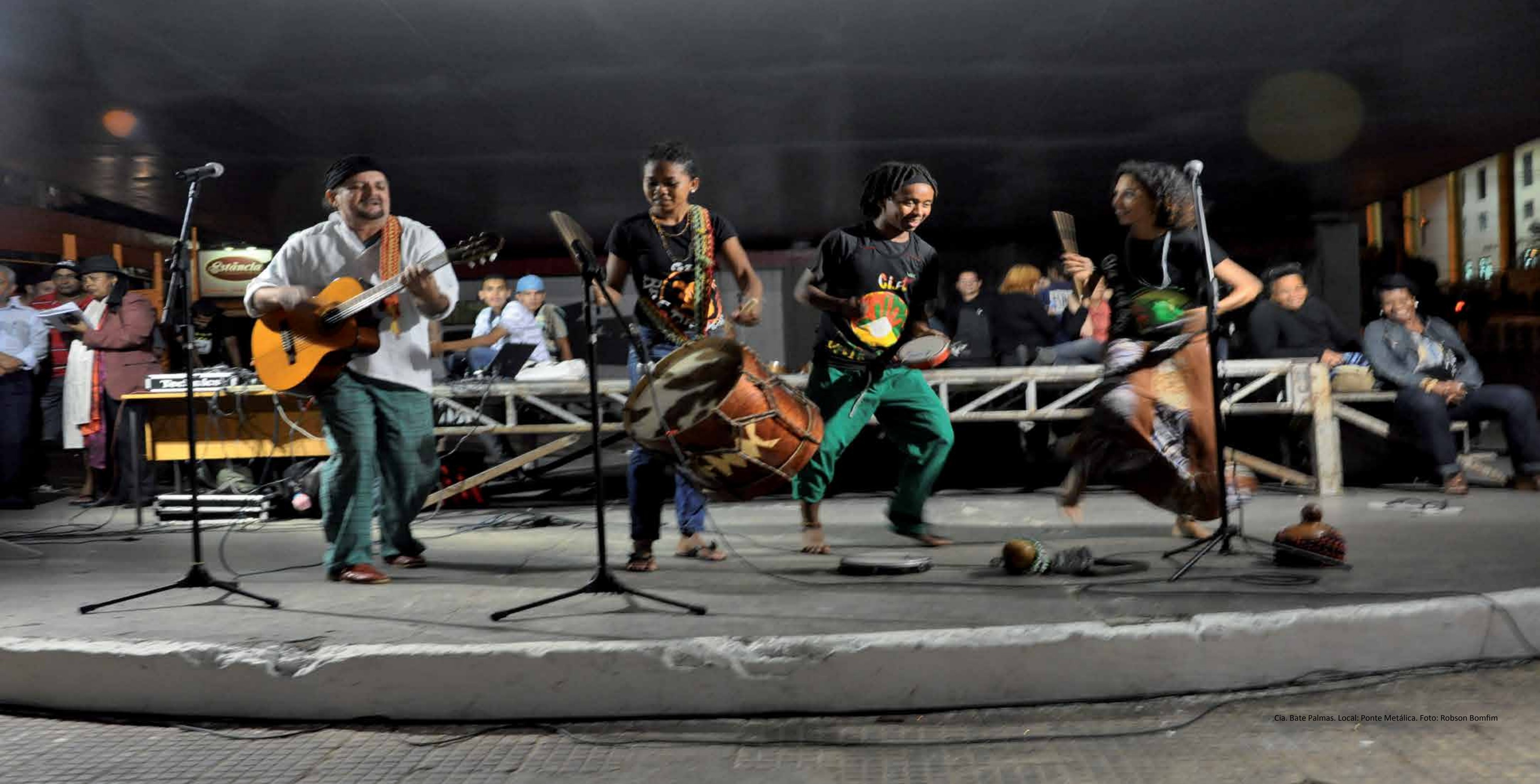
Cia. Bate Palmas. Local: Ponte Metálica.