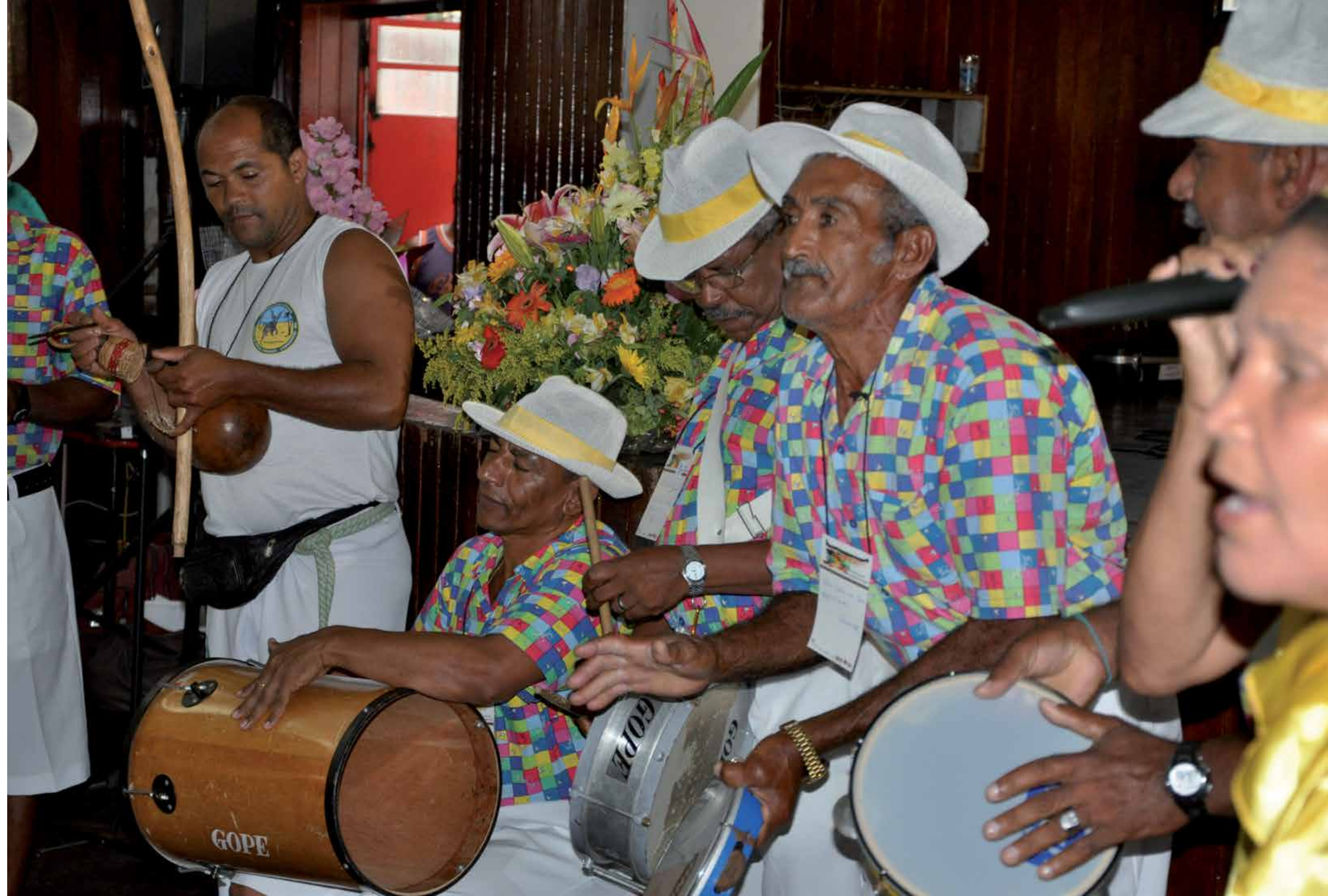
Samba de Roda. Local: Clube Floresta.

“Incomoda-me ver artista tendo que viver de outra coisa, por que não consegue sobreviver da arte (...). A primeira preocupação que temos que ter é que as pessoas que amam cultura, que produzem cultura nas mais variadas formas, possam viver de cultura com dignidade, a atividade cultural de dinamizar, a economia se dinamizar.” Emidio de Souza, Prefeito de Osasco.