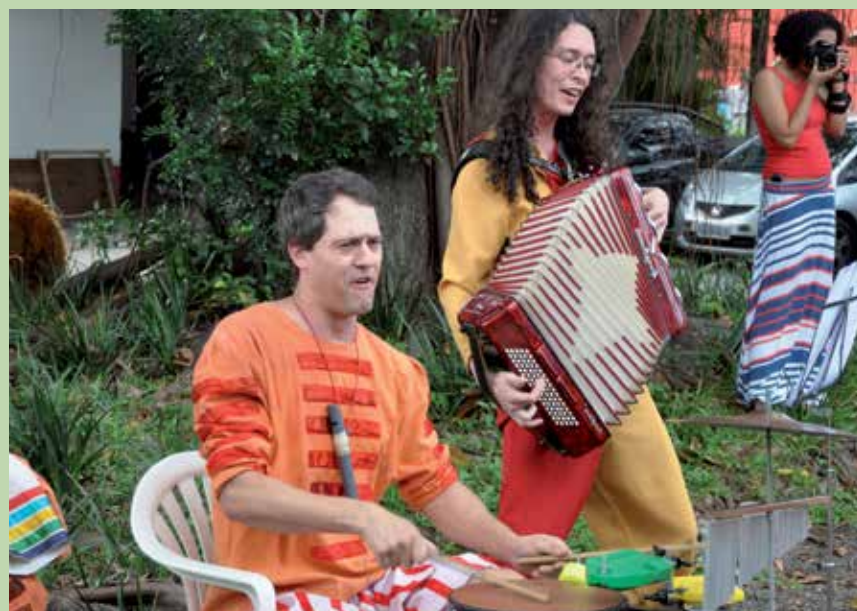
Apresentação do Grupo Commune Coletivo Teatral. Local: estacionamento do Clube Floresta.

A cultura na sua dimensão econômica adquiriu uma grande importância nas estratégias de desenvolvimento dos países do hemisfério Norte, principalmente a partir da década de 1990 do século XX. Ao pautar a produção e circulação de bens simbólicos na macrodinâmica de suas economias, países como a Austrália e a Inglaterra, cunharam o conceito economia criativa a fim de atualizar a concepção até então predominante de indústria cultural. Este novo conceito procurou incorporar, além das indústrias criativas (indústrias fonográfica, cinematográfica, editorial, internet, entretenimento e videogame) e sua produção em grande escala, processos de criação e distribuição que se dão em circuitos locais e/ou em escala restrita, como são o artesanato, design, arquitetura, arte de povos tradicionais, circuito de espetáculos, etc.