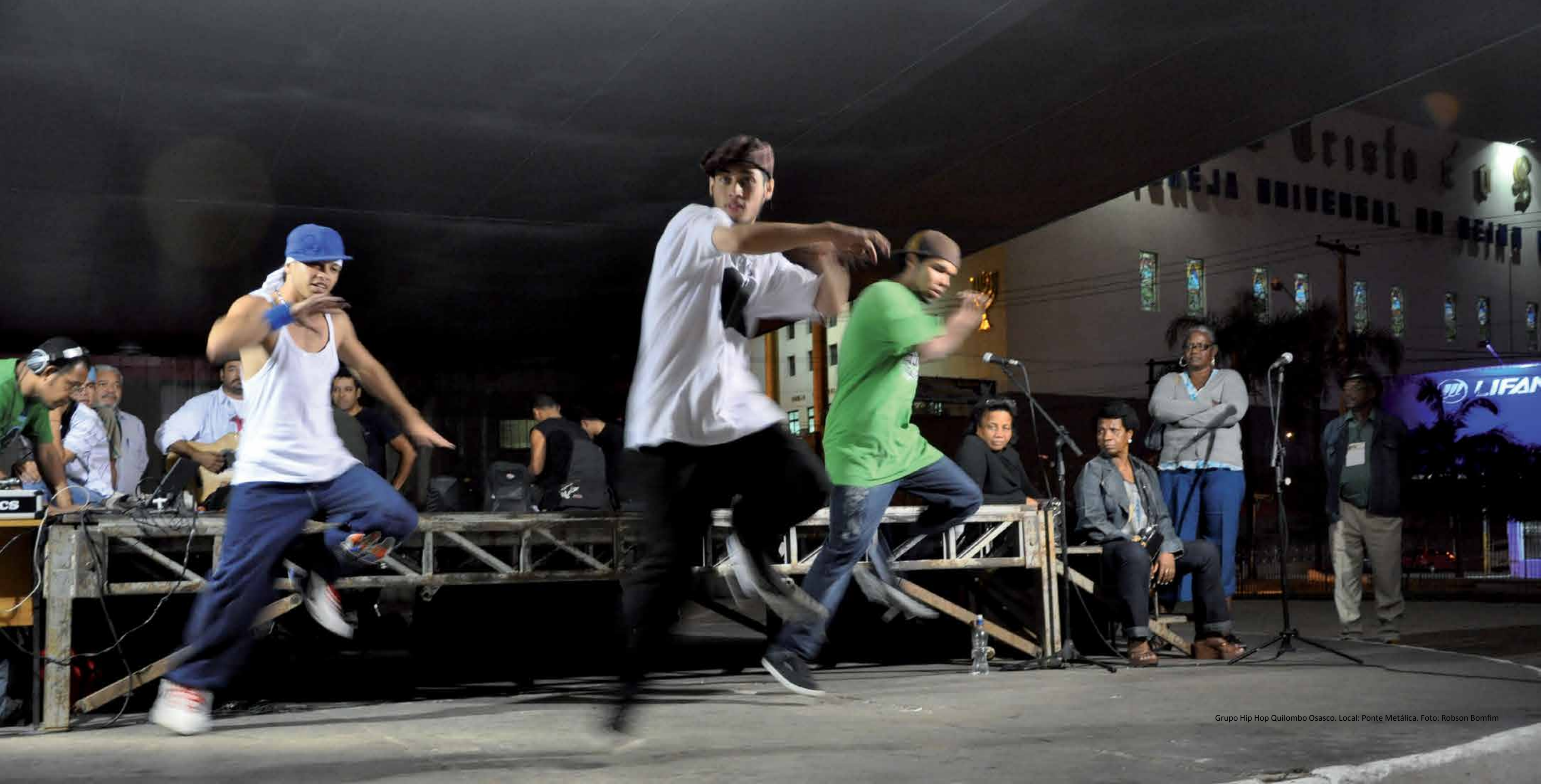
Grupo Hip Hop Quilombo Osasco. Local: Ponte Metálica.