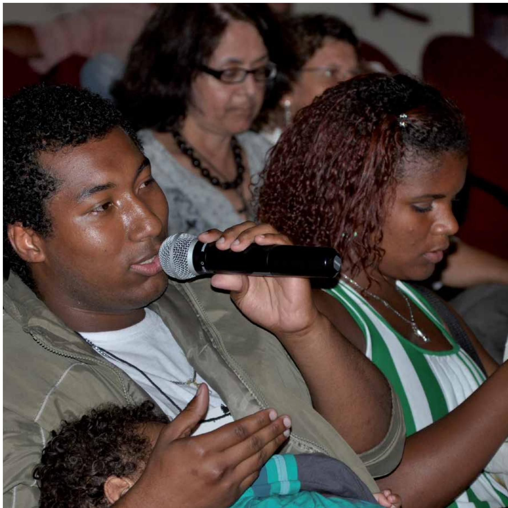
Intervenção dos participantes. Local: Teatro Municipal.