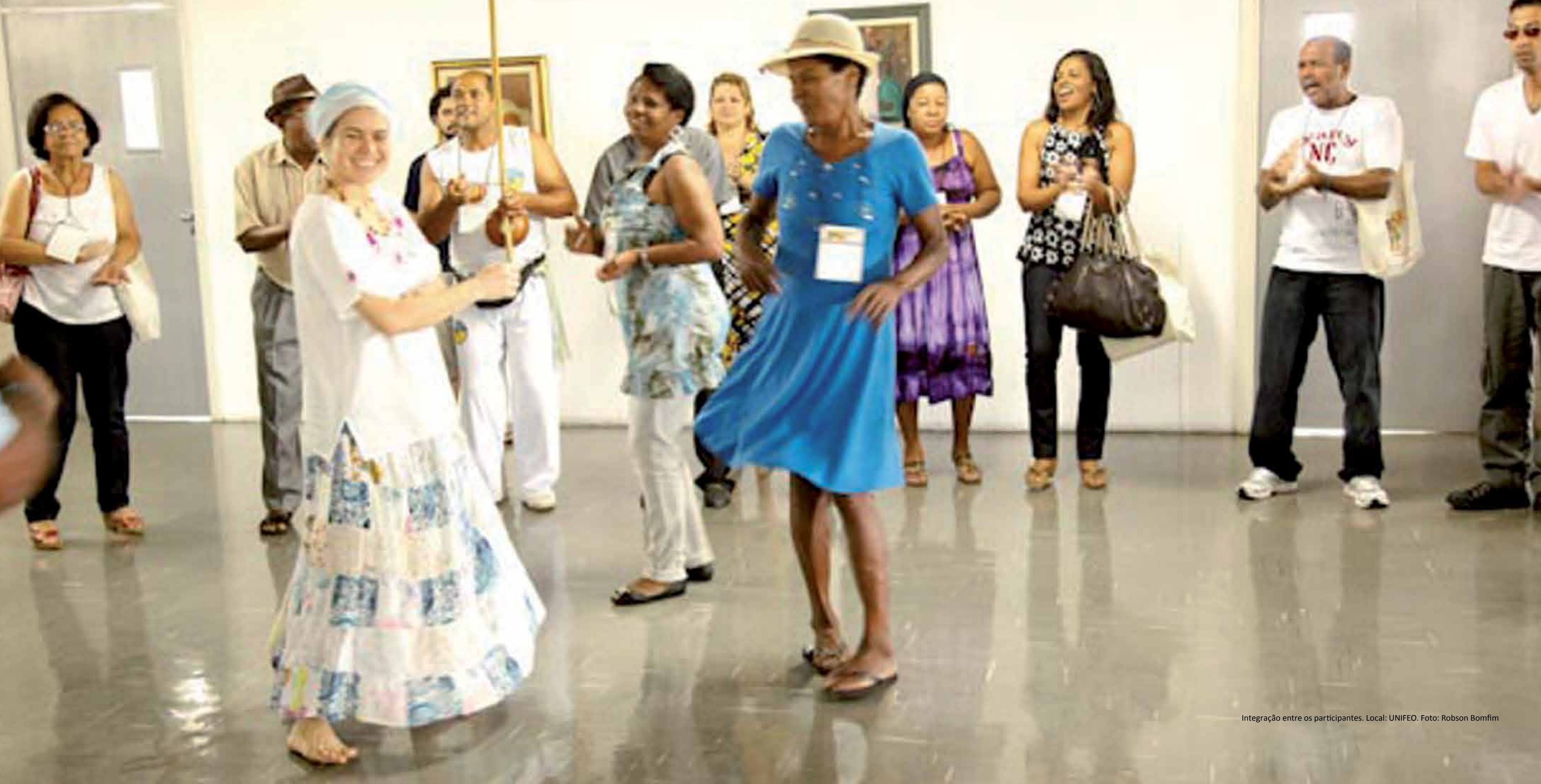
Integração entre os participantes. Local: UNIFEO.