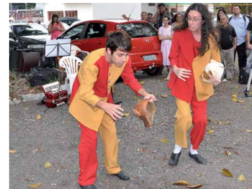
Apresentação do Grupo Commune Coletivo Teatral. Local: estacionamento do Clube Floresta.

Os novos sentidos atribuídos às formas associativas e cooperativas impulsionadas pelos trabalhadores a partir de 1990 ressaltam, sobretudo, elementos de contradição com a lógica da economia capitalista que, com seu ímpeto de acumulação privada de riqueza, é incapaz de incluir parcelas significativas da população e de proporcionar vida digna para o conjunto da sociedade. Entre esses elementos destaca-se que são formas de organização econômica baseadas no trabalho associado, na propriedade coletiva dos meios de produção, na cooperação e na autogestão. A solidariedade aparece não apenas como oposição à competição ou como traço de compaixão humana, mas também como compromisso com as lutas coletivas por transformações sociais. A constituição de entrelaçamentos em redes solidárias emerge com o propósito de criar circuitos econômicos entre empreendimentos solidários dentro de uma mesma lógica e com sustentabilidade econômica, social, ambiental e cultural. Enfim, são alguns dos princípios e vocações identificados nestas iniciativas que lhes conferem singularidade e legitimidade na elaboração de estratégias de desenvolvimento, sobretudo em âmbito local.