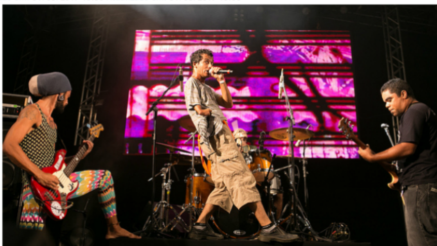
Banda integra a programação do Movimento Salve o Casarão da Várzea.

Publicado em: 31/08/2017 13:30 Atualizado em: 31/08/2017 13:38