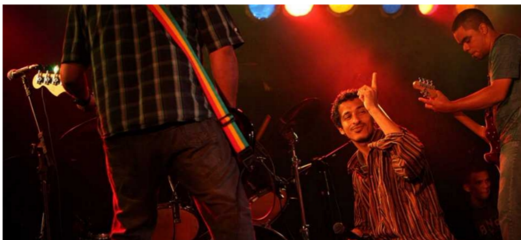
Matalanamão é referência do estilo 'anarcopunk' em Pernambuco

Com mais de duas décadas de trajetória, a banda pernambucana Matalanamão lança seu novo álbum 'Mundo Pornô' no próximo sábado (2), a partir das 17h, no Casarão da Várzea, Zona Oeste do Recife. A entrada é colaborativa e custa R$ 2, mas não é obrigatória.